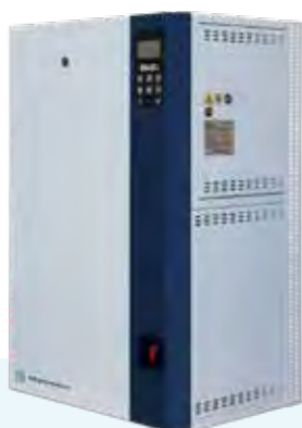
SKE4-N10 SKE4-N14 SKE4-N16 SKE4-N20 SKE4-N30