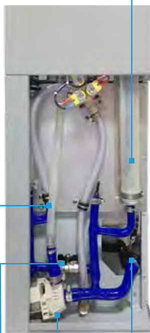
Pompe de drainage motorisée