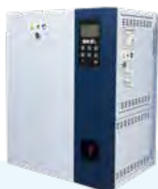
SKE4-N02 SKE4-N04 SKE4-N06

Remarque : La lettre M désigne les unités à modulation (par exemple SKE4-N20M)