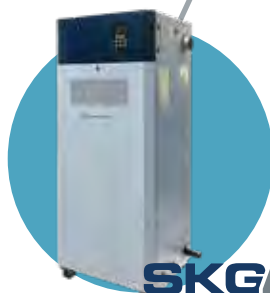
SKG4 À GAZ