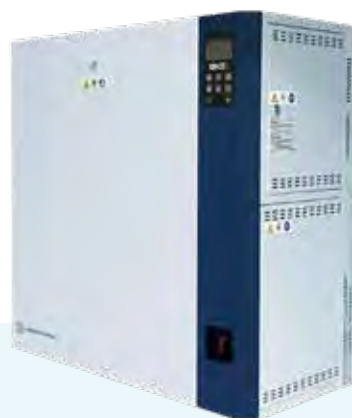
SKE4-N20L SKE4-N40 SKE4-N50 SKE4-N60