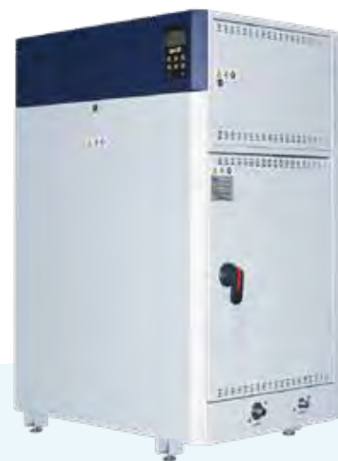
SKE4-N30X SKE4-N40X SKE4-N70 SKE4-N80 SKE4-N90 SKE4-N100