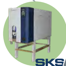
SKS4 VAPEUR À VAPEUR